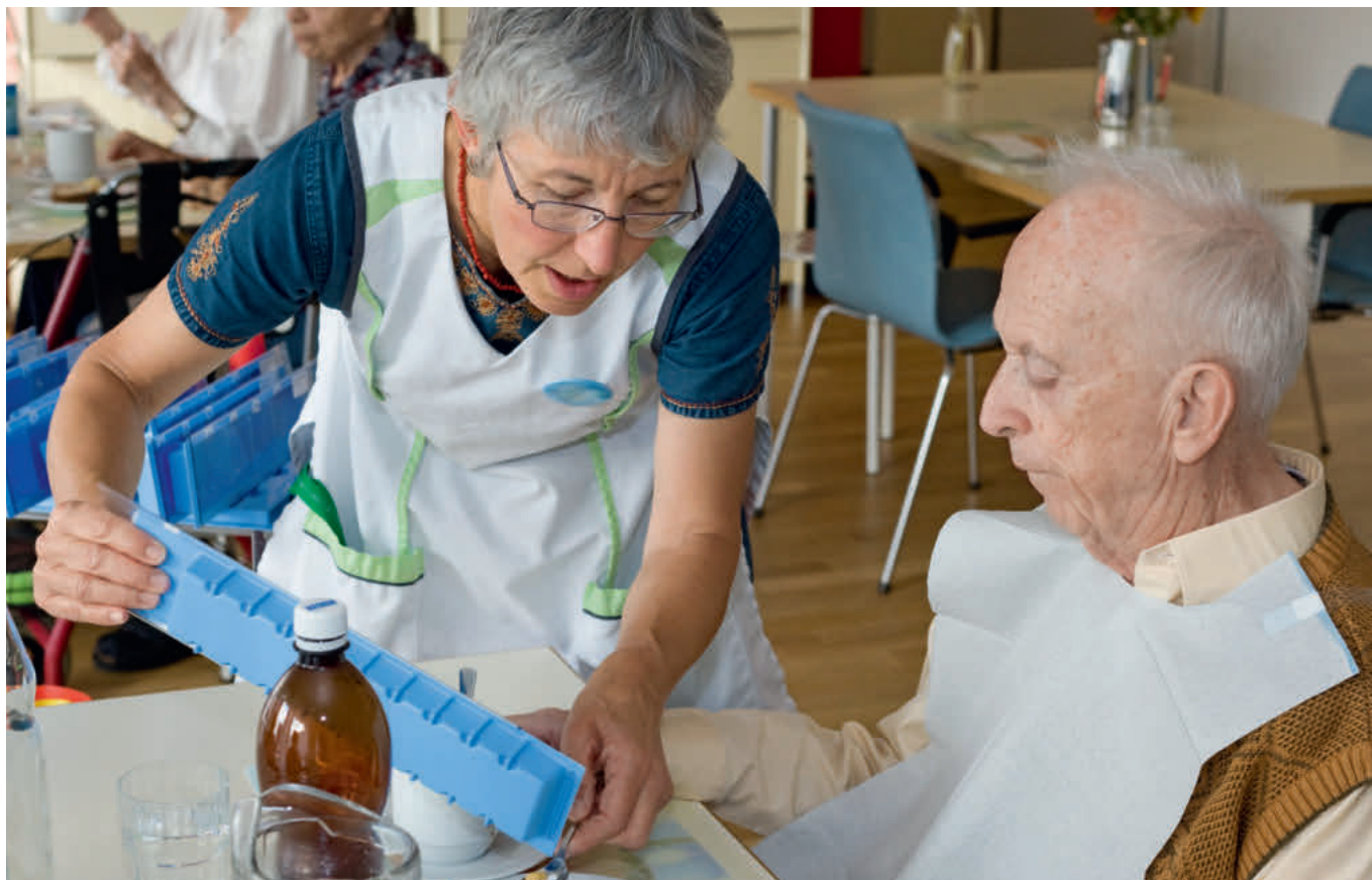
Betagte Männer und Frauen vertragen etliche Medikamente aufgrund eines veränderten Stoffwechsels nur schlecht. Dazu gehören auch Psychopharmaka, die in Pflegeheimen oft verschrieben werden.