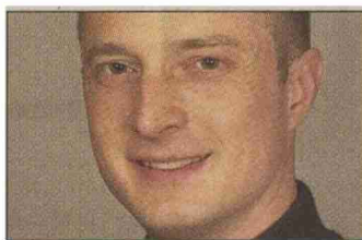
«Es braucht klare

Erstaunlicherweise führten diese Angebote dazu, dass sie nicht angenommen respektive verlangt werden. Eine Studie aus den USA zeigt, dass eine offene Fehlerkommunikation die Anzahl der Haftpflichtfälle gar reduziert. «Ein schlimmer Behandlungsfehler kann eine unglaubliche Verletzung für den Patienten bedeuten», sagt Hochreutener.