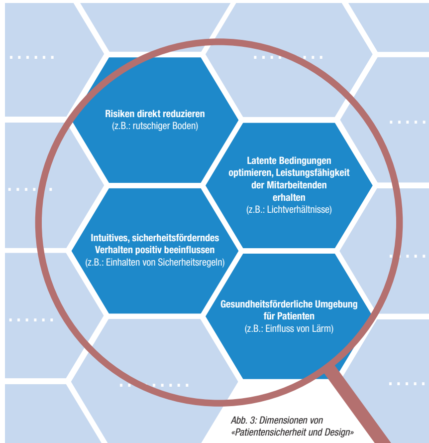
Abb. 3: Dimensionen von «Patientensicherheit und Design»

Nachfolgend werden die von uns gebildeten Dimensionen zusammenfassend vorgestellt: