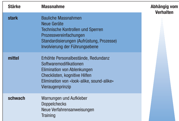
Abb. 1: St. Pierre M. Hofinger G. Human Factors und Patientensicherheit in der Akutmedizin (3. Auflage). Berlin: Springer-Verlag; 2014.

Anpassungen auf Systemebene stellen starke Massnahmen dar, da sie nur geringfügig vom bewussten Verhalten abhängig sind. Verbesserungsmassnahmen im Bereich des Spitaldesigns (Gestaltung, Ausstattung, Anordnung etc.) beziehen sich genau auf diese Systemebene.